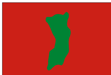
18 janv. 1964 - 29 janv. 1964