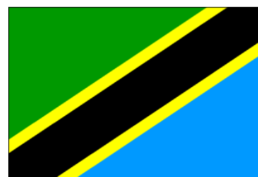
30 juin 1964 - 9 janv. 2005 (drapeau tanzanien)