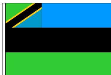
Actuel - Adopté le 10 oct. 2004 (hissé officiellement le 9 janv. 2005)