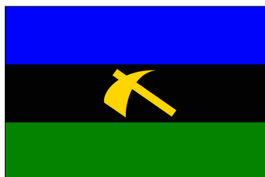
17 janv. 1964 - 29 janv. 1964 (drapeau du parti Afro-Shirazi)