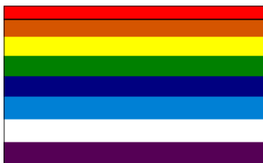
Drapeau du peuple Inca