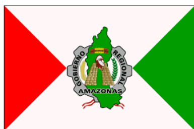
Amazonas (9 oct. 2003)