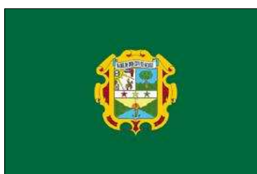
Madre de Dios