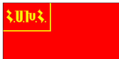
3 avr. 1927 - 23 mars 1937