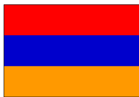
28 mai 1918 - 2 fév. 1922