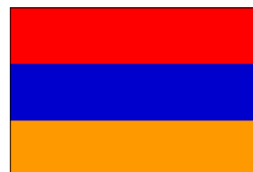
État d'Arménie orientale (22 avr. 1918 - 28 mai 1918)