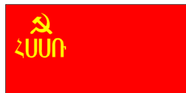
28 sept. 1940 - 17 déc. 1952