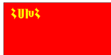
12 mars 1922 - 3 avr. 1927