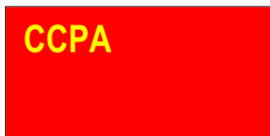
2 fév. 1922 - 12 mars 1922