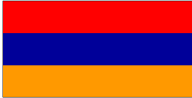
Actuel - Adopté le 24 août 1990