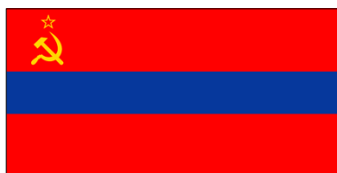
17 déc. 1952 - 24 août 1990