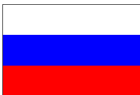
Gouvernorat d'Erevan (14 sept. 1917 - 14 avr. 1918)