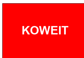
mars 1906 (proposition britannique)