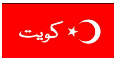
1899 - 29 juil. 1909 (pavillon local)