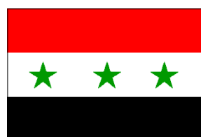
8 août 1990 - 27 févr. 1991 (occupation irakienne)