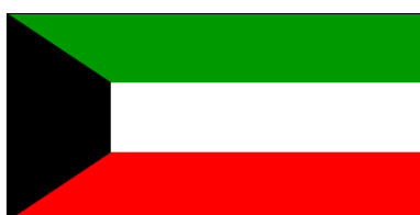
24 nov. 1961 - 8 août 1990 (décision 19 juin, loi 7 sept. 1961)