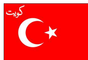
29 juil. 1909 - 19 nov. 1914 (pavillon local)