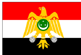
18 juin 1953 - 22 févr. 1958 (drapeau de la Révolution)