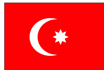
16 mars 1803 - 8 juin 1867