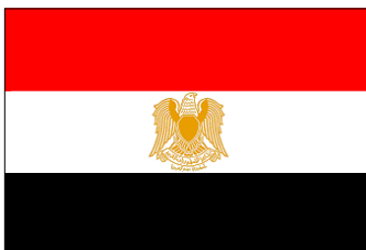
1 er janv. 1972 - 4 oct. 1984 (Fédération des Républiques arabes)