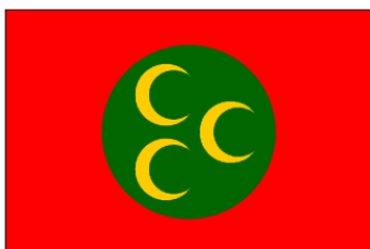
22 janv. 1517 - 27 juin 1793