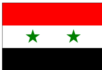
22 févr. 1958 - 31 déc. 1971