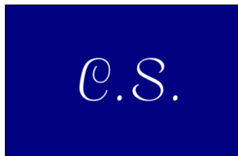
Compagnie du canal de Suez (1858 - 26 juil. 1956)