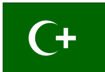
Révolution égyptienne (1918 - 1919)