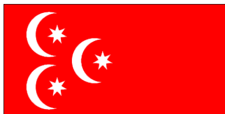
13 sept. 1881 - 18 déc. 1914