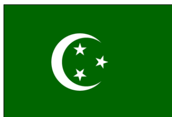
10 déc. 1923 - 18 juin 1953