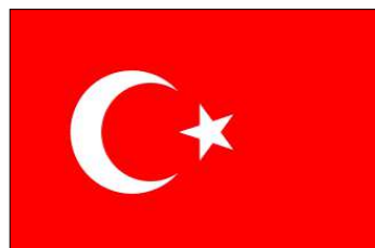
8 juin 1867 - 13 sept. 1881