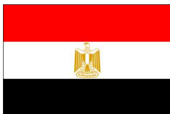
Actuel - Adopté le 4 oct. 1984