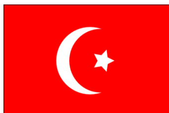
1844 - 8 juin 1867 (drapeau local)