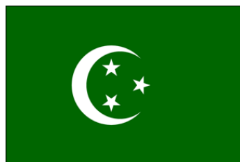
18 juin 1953 - 22 févr. 1958 (drapeau national)