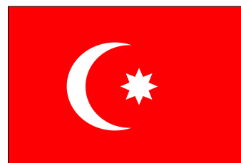
27 juin 1793 - 25 juil. 1798