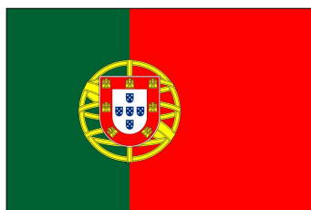
11 juin 1951 - 21 déc. 1974 (Drapeau portugais)