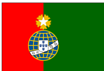
5 oct. 1910 - 29 nov. 1910 (Révolution portugaise)