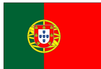
29 nov. 1910 - 11 juin 1951 (République portugaise)