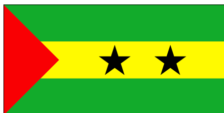
12 juil. 1975 - 5 nov. 1975 (Drapeau du MLSTP)