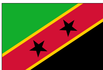
21 déc. 1974 - 12 juil. 1975