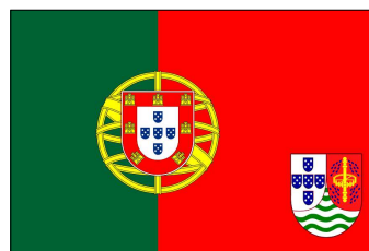
1967 (Projet non réalisé)