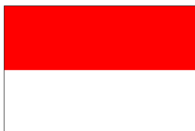
Territoire de Java central (1 er déc. 1949-9 mars 1950)