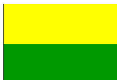
État de Sumatra du Sud (30 août 1948-24 mars 1950)