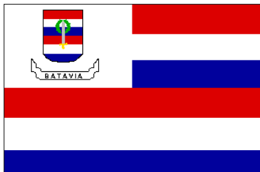
Batavia (11 août 1948-27 déc. 1949)