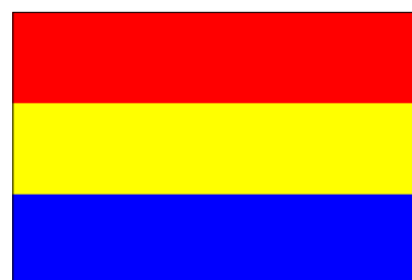
Territoire du « Grand Dayak » (7 déc. 1946-4 avril 1950)