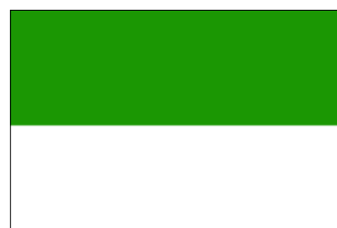
État de Java oriental (16 nov. 1948-9 mars 1950)