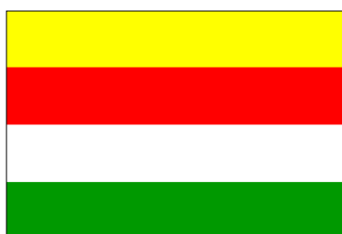
État d'Indonésie orientale (24 déc. 1946-17 août 1950)