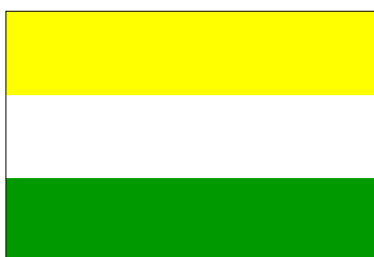
État de Sumatra oriental (25 déc. 1947-17 août 1950)