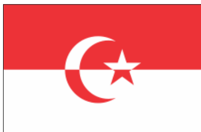
7 août 1949-4 juin 1962 (Java occidentale)