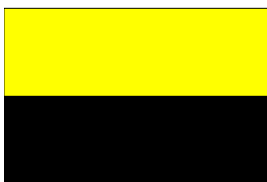
Territoire de Bandjar (14 janv. 1948-4 avril 1950)