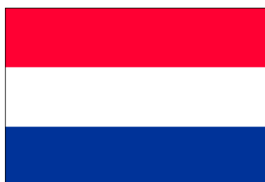
Territoire de Sabang (29 sept. 1945-9 mars 1950)