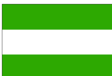
État soundanais (Pasundan) (23 fév. 1948-11 mars 1950)