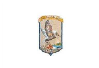
Drapeau local actuel Adopté le 26 oct. 2010