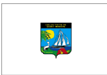
Drapeau local (non officiel) (jusqu'au 26 oct. 2010)