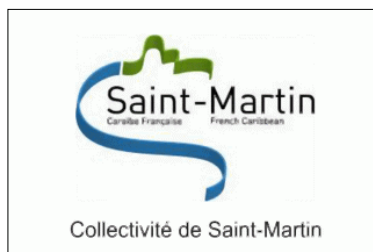
Drapeau du Conseil Régional (adopté en 2009)