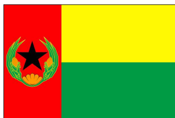
5 juil. 1975 - 22 sept. 1992