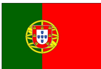
19 déc. 1974 - 5 juil. 1975 (Drapeau portugais)