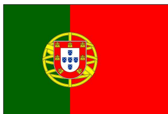
11 juin 1951 - 19 déc. 1974 (Drapeau portugais)