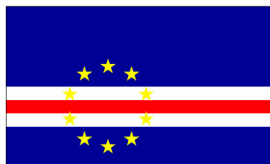
Actuel - Adopté le 22 sept. 1992