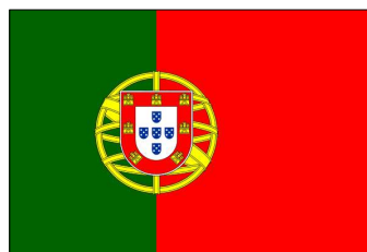
29 nov. 1910 - 11 juin 1951 (République portugaise)