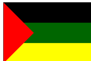
1 er mai 1920 - 2 nov. 1921