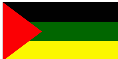
8 janv. 1926 - 22 sept. 1932 (drapeau du Hedjaz)