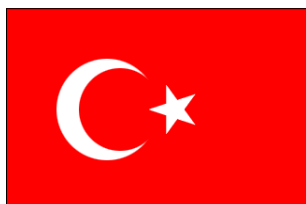
Juin 1871 - 13 mai 1913 (drapeau de l'Empire ottoman)