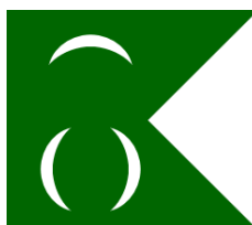
Jusqu'au 10 juin 1916