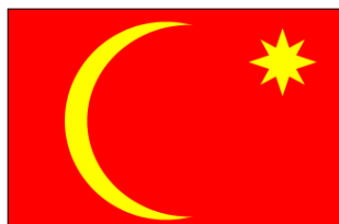
15 janv. 1902 - 1 er mai 1920