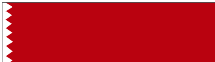
Juin 1871 - 13 mai 1913 (drapeau local)