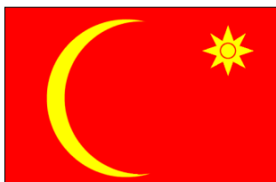
± 1835 - 15 janv. 1902