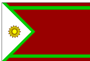
Adopté le 1 er mai 2002