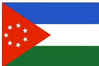
25 avril 1950-2 mai 1950